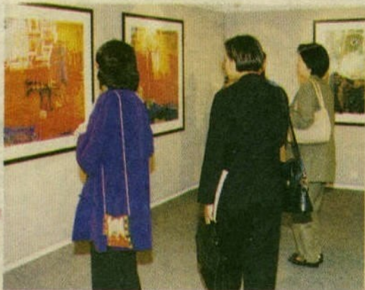
易凱的作品，引來不少捧場客駐足觀賞。

《天、地、水和陰陽之一》，天地、水及陰陽是作者最愛用的元素，因為這都是大家所熟悉的。